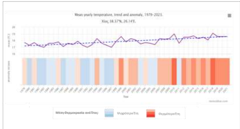
Εικόνα 1: Ετήσια Αλλαγή Θερμοκρασίας στη Χίο έτη 1979 – 2023

Όσον αφορά στη μεταβολή της θερμοκρασίας η γραμμή τάσης της κλιματικής αλλαγής (διακεκομμένη μπλε γραμμή) παρουσιάζει σαφή ανοδική πορεία ιδίως από το έτος 2007 σημειώνοντας τις υψηλότερες τιμές της τα έτη 2010 και 2018. Η κατανομή των βροχοπτώσεων φαίνεται να παρουσιάζει, με ορισμένες διακυμάνσεις, πιο ξηρό κλίμα μέχρι το έτος 2008 ενώ από το 2009 έως σήμερα οι βροχοπτώσεις παρουσιάζουν μικρή ανοδική τάση.